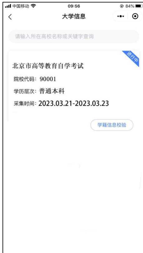
选择相应的学历层次