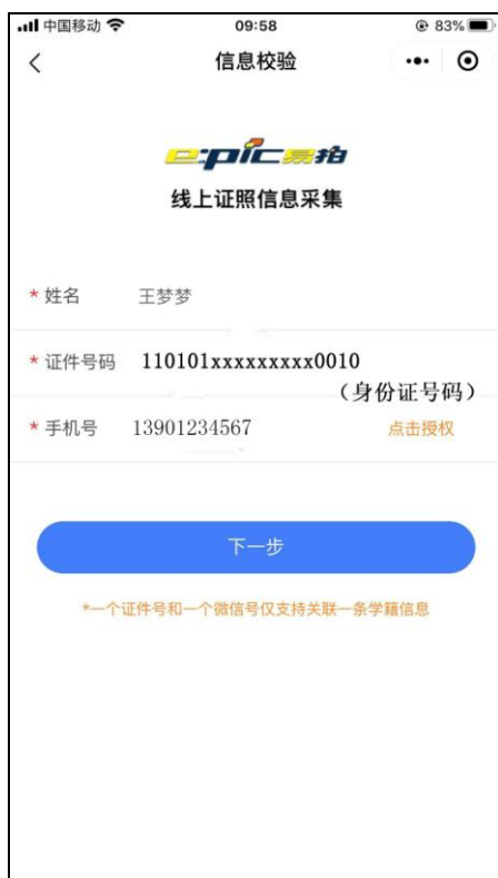
输入完整信息（证件号码为身份证号码）