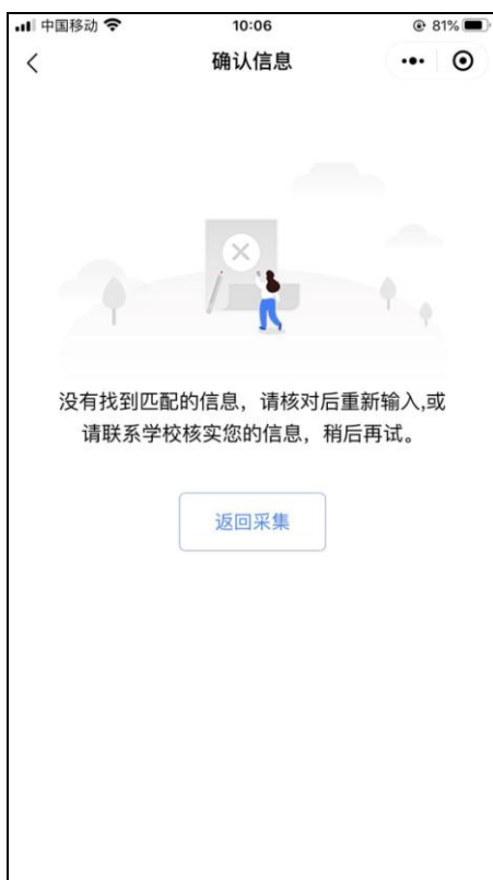
信息无法确认页面