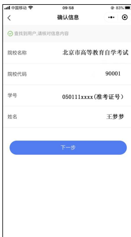
确认信息（学号为准考证号码）