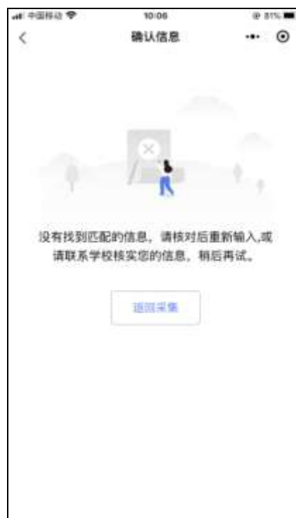
信息无法确认页面