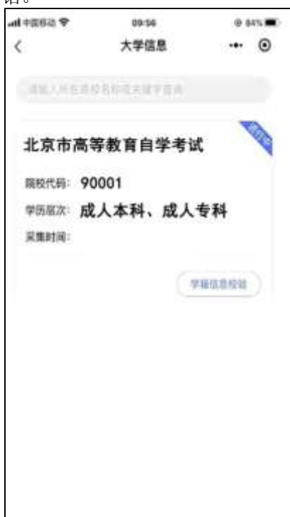
选择相应的学历层次